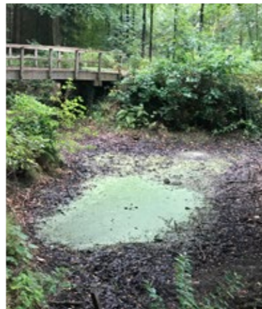
Verval in de Heidetuin