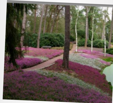
Handen uit de mouwen voor fameuze heidepracht!

Nieuwe, droogtebestendige heide en bomen worden aangeplant. De waterpartijen worden opgeschoond en op natuurlijke wijze beschoeid. Er komen nieuwe bruggen en bankjes en de wandelpaden krijgen een nieuwe toplaag.