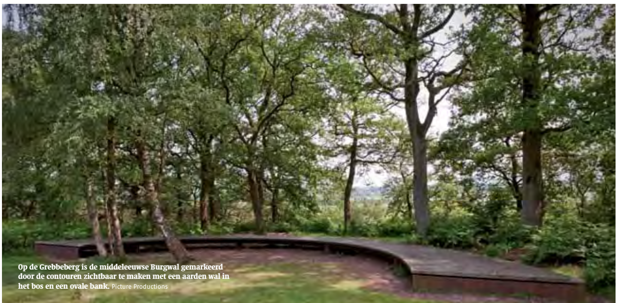
Op de Grebbeberg is de middeleeuwse Burgwal gemarkeerd door de contouren zichtbaar te maken met een aarden wal in het bos en een ovale bank.