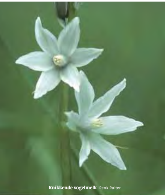
Knikkende vogelmelk Renk Ruiter