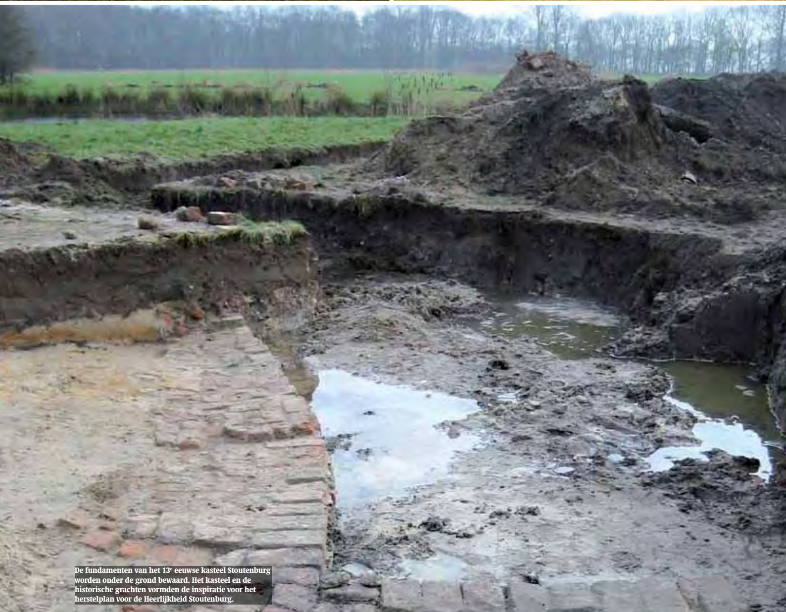
De fundamenten van het 13 e eeuwse kasteel Stoutenburg worden onder de grond bewaard. Het kasteel en de historische grachten vormden de inspiratie voor het herstelplan voor de Heerlijkheid Stoutenburg.