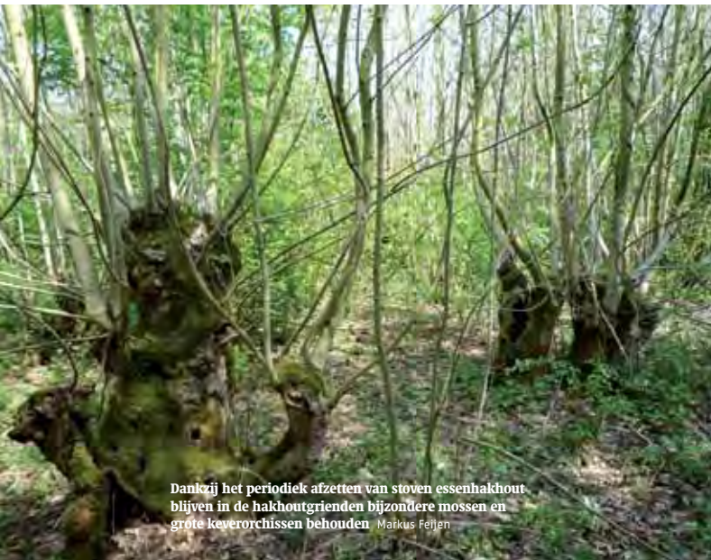
Dankzij het periodiek afzetten van stoven essenhakhout blijven in de hakhoutgrienden bijzondere mossen en grote keverorchissen behouden. Maikus Feijlen