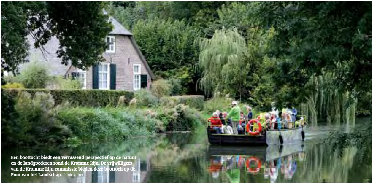
Een boottocht biedt een verrassend perspectief op de natuur en de landgoederen rond de Kromme Rijn. De vrijwilligers van de Kromme Rijn commissie bieden deze boottocht op de Pont van het Landschap. Renk Ruiter