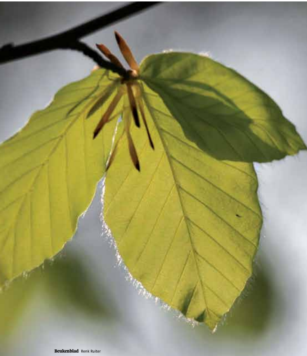
Beukenblad Renk Ruiter