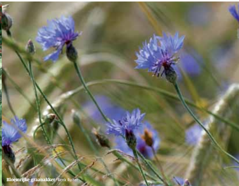
Bloemrijke graanakker Renk Ruiters