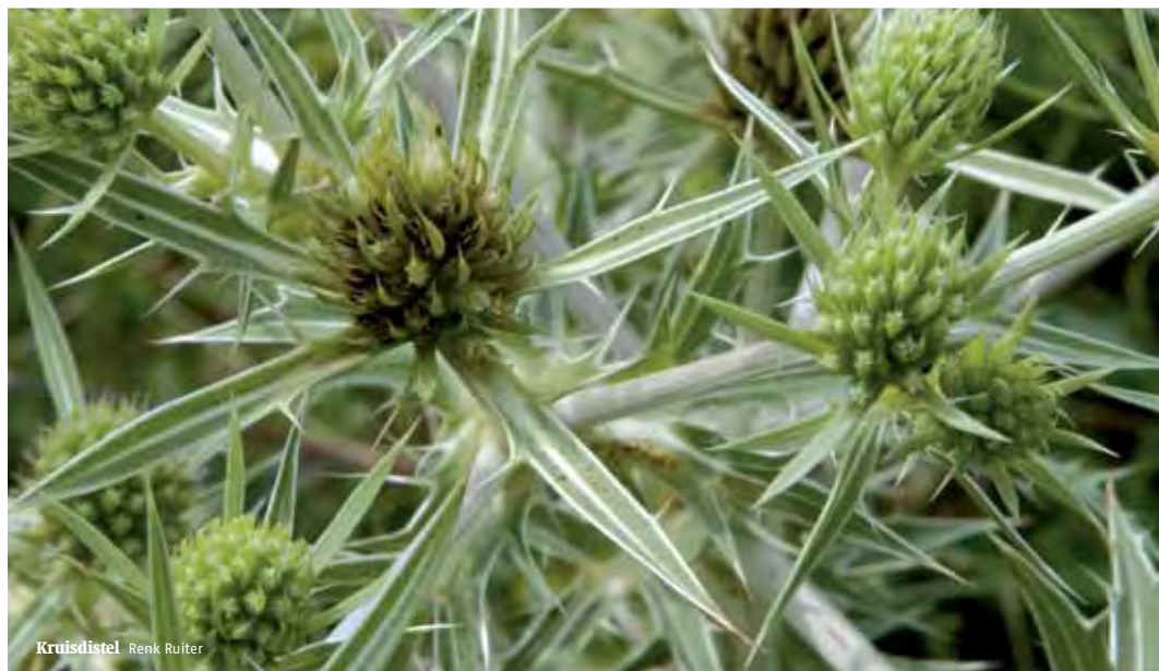
Kruisdistel Renk Ruiter