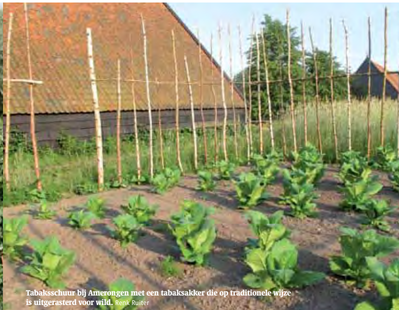
Tabaksschuur bij Amerongen met een tabaksakker die op traditionele wijze is uitgerasterd voor wild. Renk Ruijter

van de functie 'wonen' naar de functie 'productie' bestond. Naast de staat van onderhoud wordt de beleving sterk gestuurd door (recreatieve) routes, het creëren van uitzichtpunten, plaatsing van banken en dergelijke. De routes worden zo ingericht dat aan de bezoeker van onze terreinen zowel een cultuurhistorisch verhaal als de ervaring van een mooi landschap kan worden meegegeven.