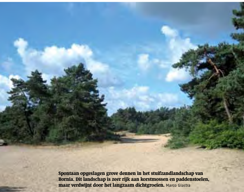
Spontaan opgeslagen grove dennen in het stuifzandlandschap van Bornia. Dit landschap is zeer rijk aan korstmossen en paddenstoelen, maar verdwijnt door het langzaam dichtgroeien. Marco Glastra