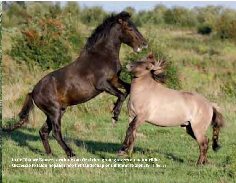
In de Blauwe Kamer is ruimte om de rivier, grote grazers en natuurlijke successie te laten bepalen hoe het landschap er uit komt te zien. Renk Ruitjer

pestbosjes op afstand van de vroegere boerderijen. Ook hier is de samenhang tussen gebouwen en landschap belangrijk, zoals bij historische boerderijen met hun erfbeplanting, de steenfabriek in de uiterwaard of molens waaromheen een boomloos molenbiotoop een goede windvang moest garanderen. In alle gevallen is de samenhang tussen bebouwing en cultuurlandschap voor ons een belangrijk uitgangspunt.