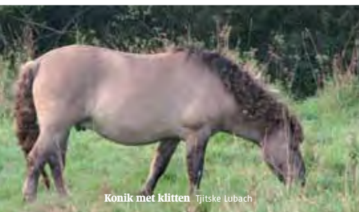
Konik met klitten Tjitske Lubach