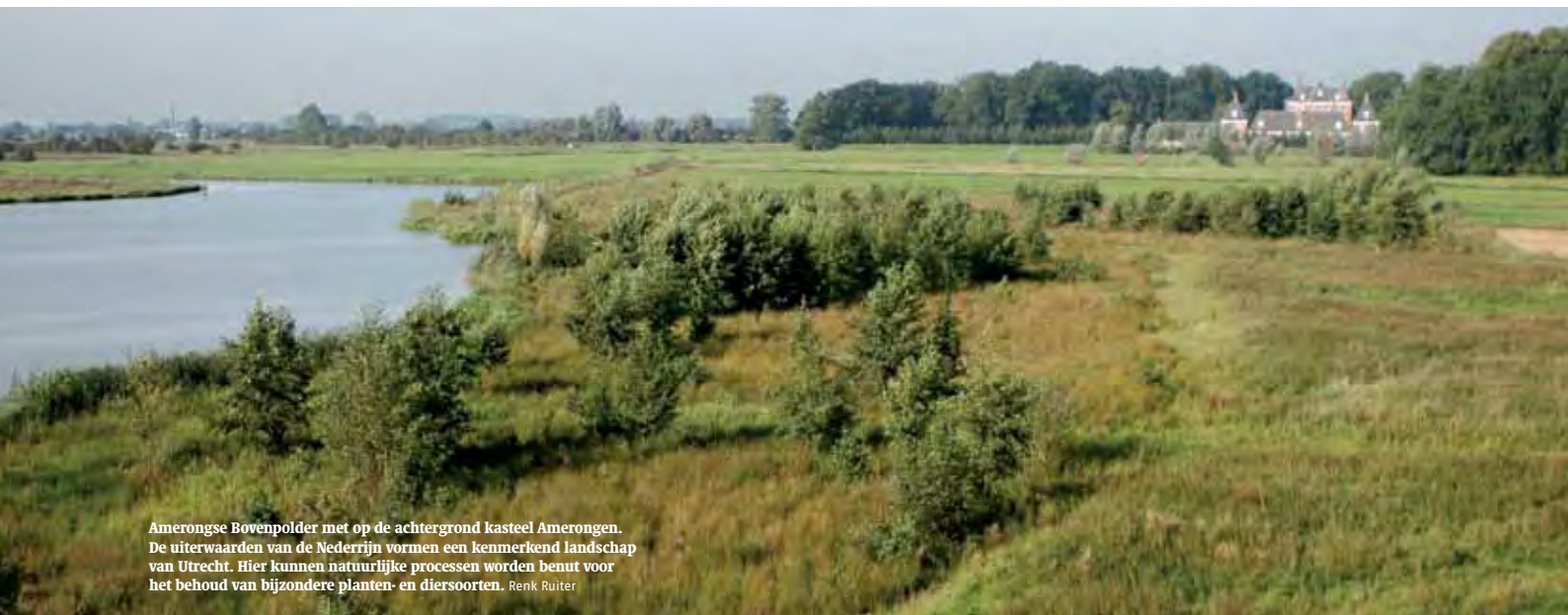
Amerongse Bovenpolder met op de achtergrond kasteel Amerongen. De uiterwaarden van de Nederrijn vormen een kenmerkend landschap van Utrecht. Hier kunnen natuurlijke processen worden benut voor het behoud van bijzondere planten- en diersoorten. Renk Ruiter

'Landschap' en 'cultuurhistorie' zijn begrippen die in elkaars verlengde liggen. Het begrip 'landschap' is een Nederlandse 'uitvinding' en stamt uit de 17de eeuw. Het Engelse landscape en het Duitse Landschaft zijn afgeleid van het Nederlandse 'landschap'. In de Europese landschapsconventie wordt landschap als volgt gedefinieerd: "een gebied, zoals dat door mensen wordt waargenomen, waarvan het karakter bepaald wordt door