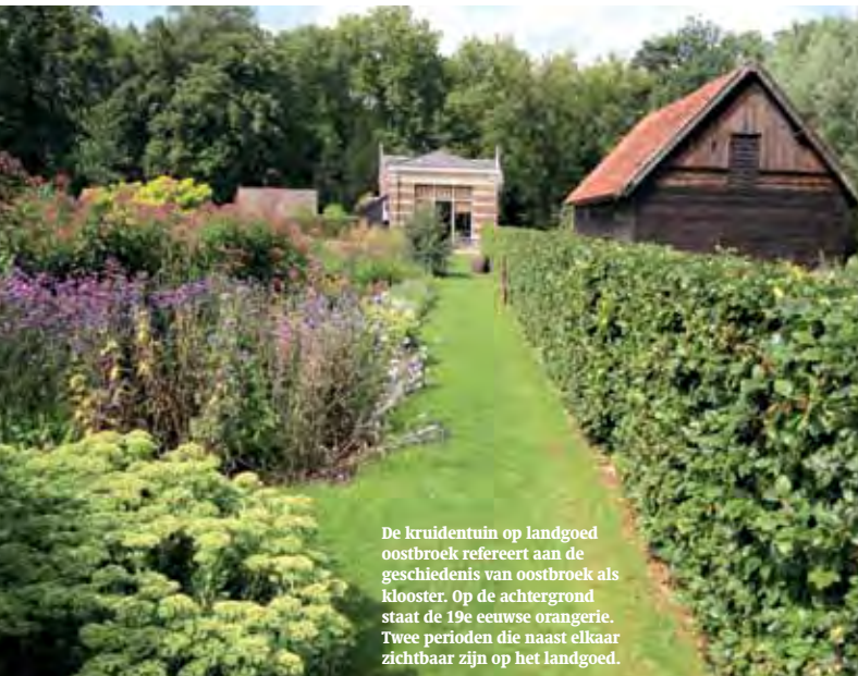
De kruidentuin op landgoed oostbroek refereert aan de geschiedenis van oostbroek als klooster. Op de achtergrond staat de 19e eeuwse orangerie. Twee perioden die naast elkaar zichtbaar zijn op het landgoed.