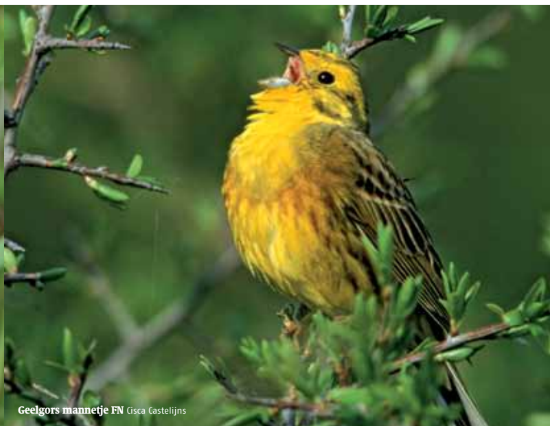
Geelgors mannetje FN Gisca Castelljns