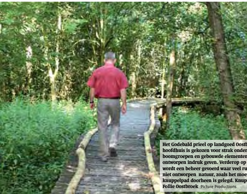
Het Godebald prieel op landgoed Oostbroek. Nabij het hoofdhuis is gekozen voor strak onderhouden gazon, boomgroepen en gebouwde elementen die een sterk ontworpen indruk geven. Verderop op het landgoed wordt een beheer gevoerd waar veel ruimte is voor niet ontworpen natuur, zoals het moerasbos waar een knuppelpad doorheen is gelegd. Knuppelpad Follie Oostbroek Picture Productions

Kwaliteit is bij het maken van de keuzes een belangrijk uitgangspunt, waarbij kwaliteit steeds per gebied moet worden gedefinieerd. Om hier handen en voeten aan te geven, wordt in de beheerplannen een werkwijze gevolgd zoals aan het einde van dit hoofdstuk is be-