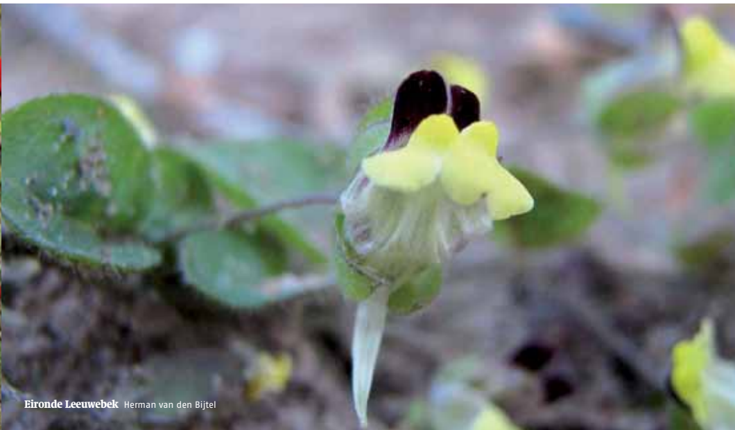
Eironde Leeuwebek Herman van den Bijtel

zomergranen kiezen of 's winters een stoppelveld met resten van de oogst laten staan. We willen onderzoeken hoe ons beheer nog beter kan worden afgestemd op vlinders en broedende akkervogels. Vanwege het kleine oppervlak van de afzonderlijke akkers zal daarvoor de landschappelijk context ook van belang zijn, in de vorm van alternatieve nectarplanten (vlinders) en rustgebieden en andere voedselbronnen (vogels).