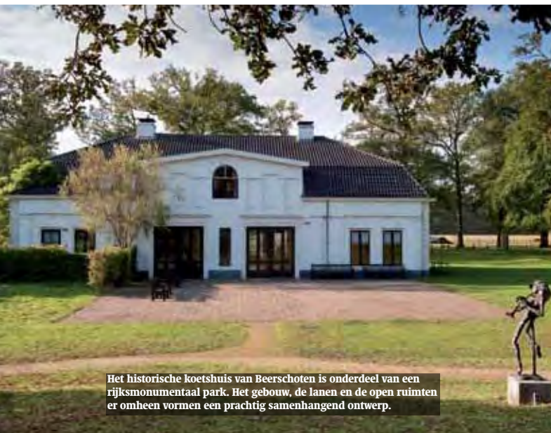
Het historische koetshuis van Beerschoten is onderdeel van een rijksmonumentaal park. Het gebouw, de lanen en de open ruimten er omheen vormen een prachtig samenhangend ontwerp.