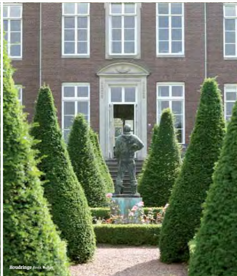
Houdringe Renk Ruitter