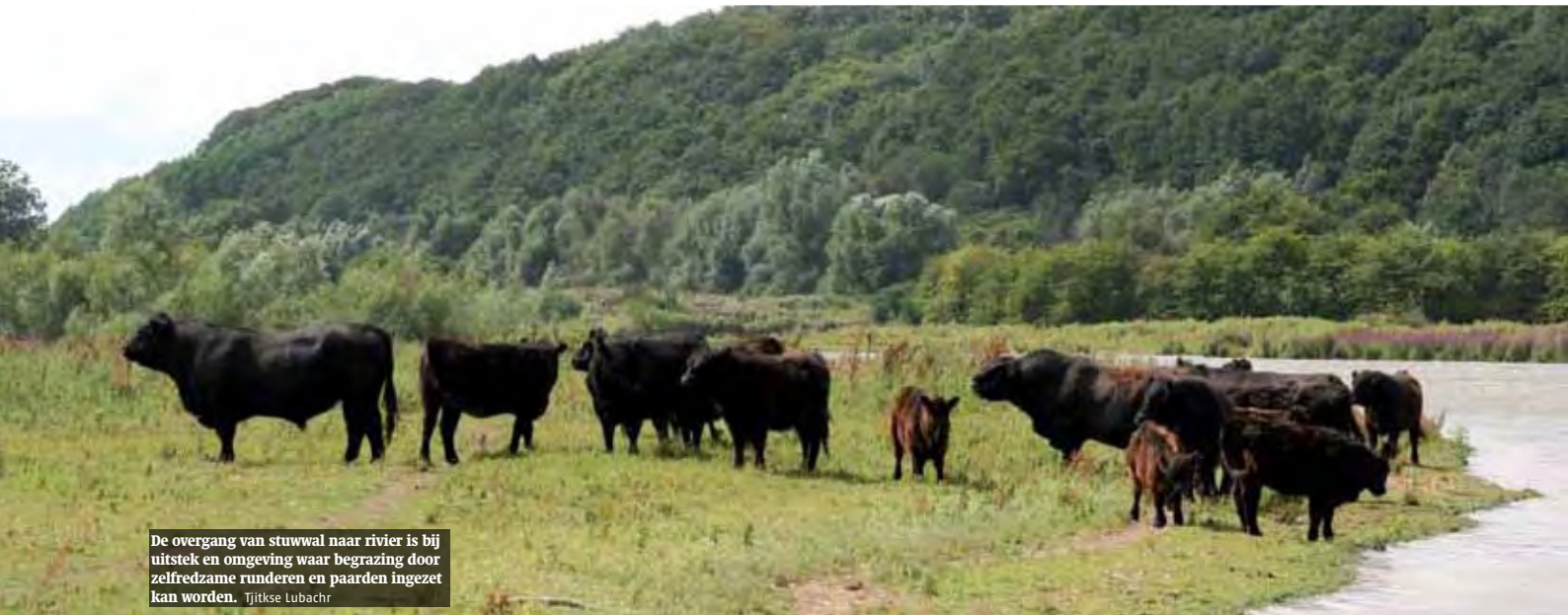
De overgang van stuwwal naar rivier is bij uitstek en omgeving waar begrazing door zelfredzame runderen en paarden ingezet kan worden. Tjitkse Lubach

schreven en die zorgt dat zowel natuur als landschap en cultuurhistorie een plaats krijgen in het beheer.