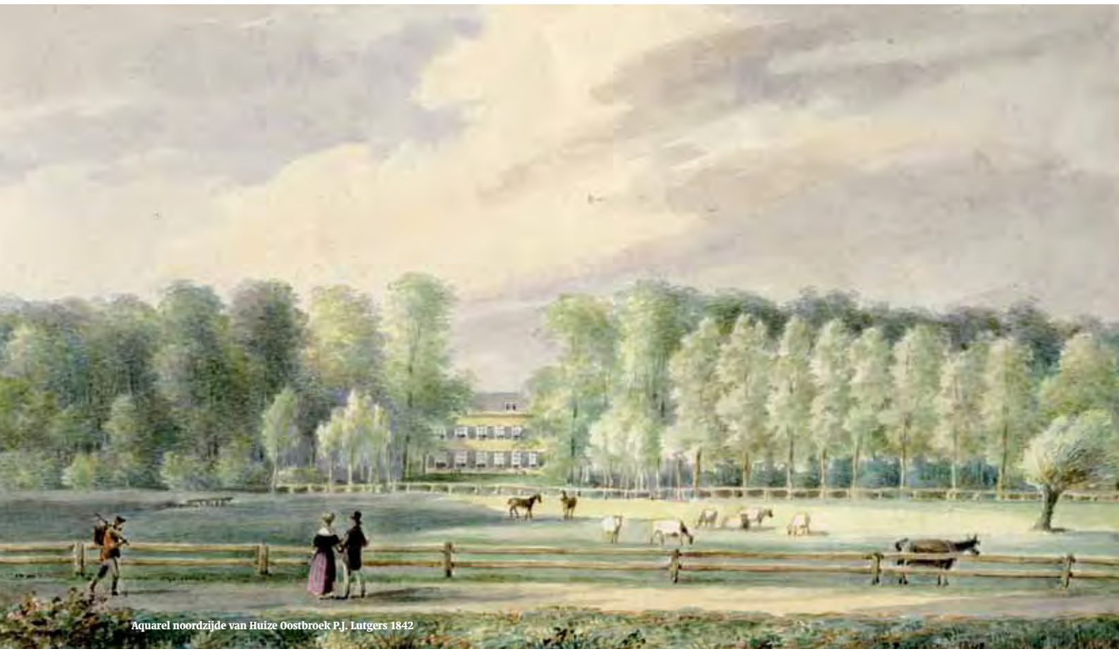
Aquarel noordzijde van Huize Oostbroek P.J. Lutgers 1842