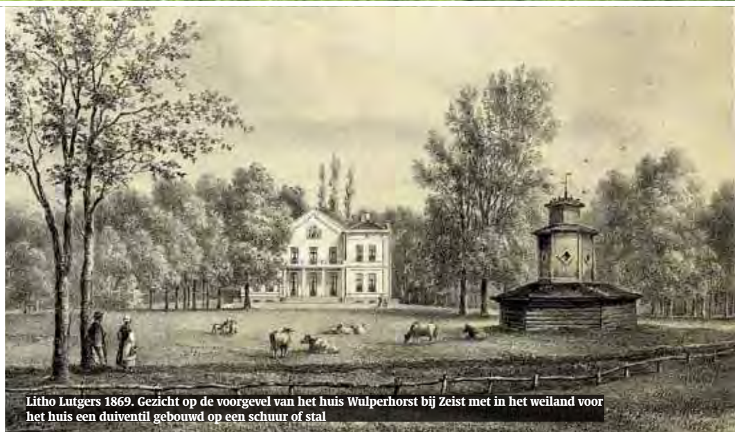
Litho Lutgers 1869. Gezicht op de voorgevel van het huis Wulperhorst bij Zeist met in het weiland voor het huis een duiventil gebouwd op een schuur of stal