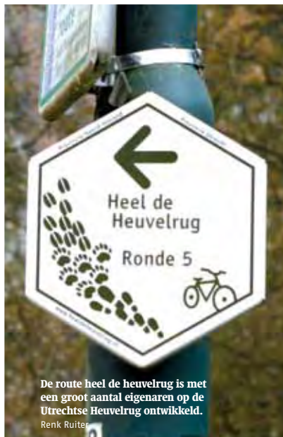
De route heel de heuvelrug is met een groot aantal eigenaren op de Utrechtse Heuvelrug ontwikkeld. Renk Ruiter