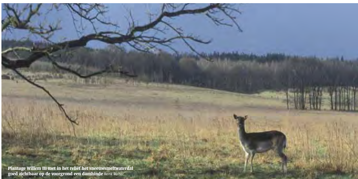
Plantage Willem III met in het reliëf het sneeuwsmeltwaterdal goed zichtbaar op de voorgrond een damhinde Renk Rüter

natuurlijke en/of menselijke factoren en de interactie daar tussen”. In het Landschapsmanifest, mede onderkend door De 12 Landschappen, staat: “Landschap vormt onze zichtbare omgeving. Het vertelt ons het verhaal over de geschiedenis van onze leefomgeving, het verklaart de verschillen en de samenhang. Niet alleen heeft het landschap zijn eigen identiteit, het vormt ook onderdeel van onze eigen identiteit.”