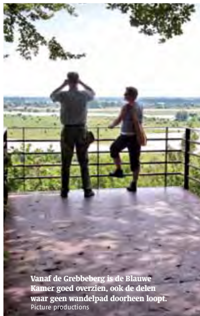
Vanaf de Grebbeberg is de Blauwe Kamer goed overzien, ook de delen waar geen wandelpad doorheen loopt.