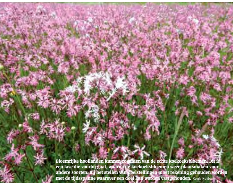
Bloemrijke hooilanden kunnen roeien van de echte koekoeksbloemen. Dit is een fase die voorbij gaat, waarna de koekoeksbloemen weer plaatsmaken voor andere soorten. Bij het stellen van doelstellingen moet rekening gehouden worden met de tijdsperiode waarover een doel kan worden vastgehouden. Renk Ruiters