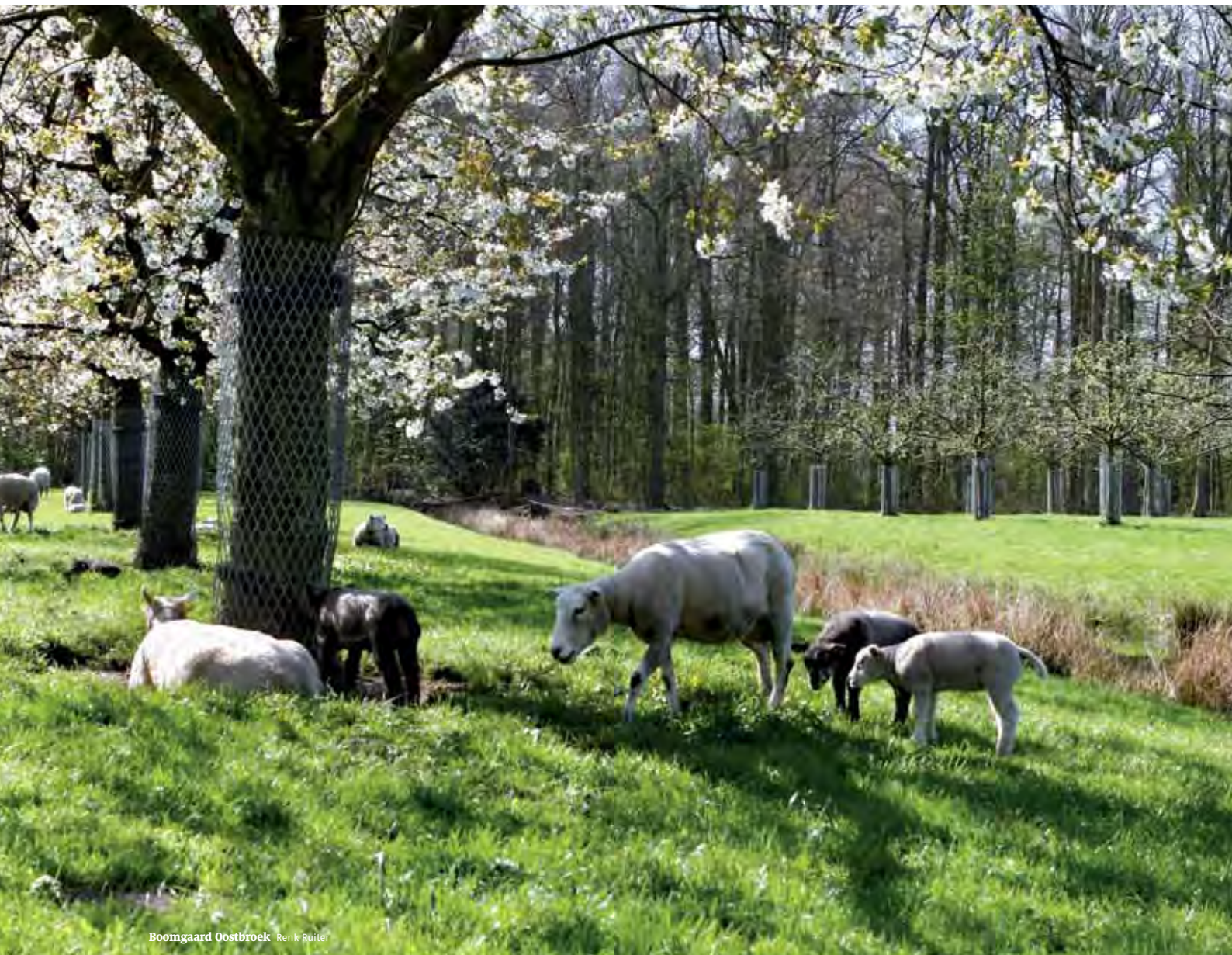
Boomgaard Oostbroek Renk Rüter