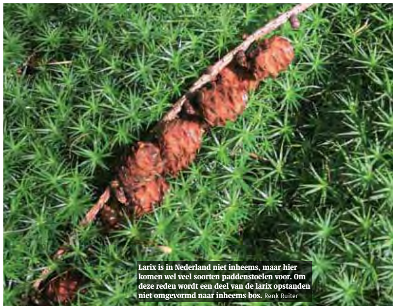
Larix is in Nederland niet inheems, maar hier komen wel veel soorten paddenstoelen voor. Om deze reden wordt een deel van de Larix opstanden niet omgevormd naar inheems bos. Renk Ruiter