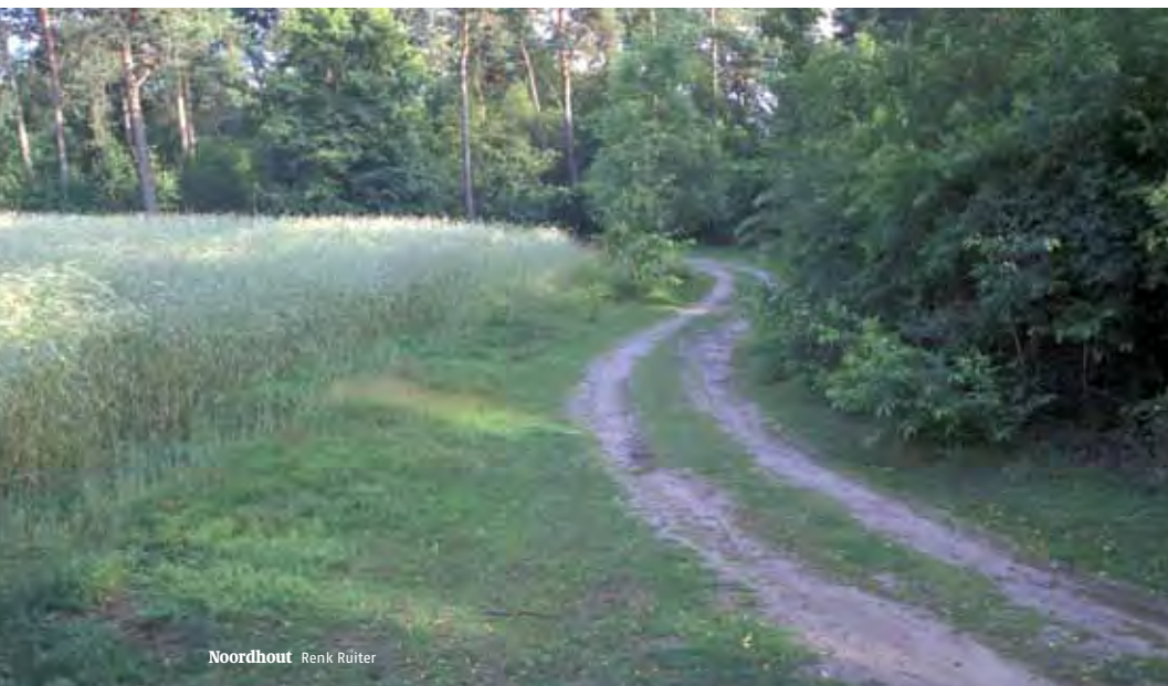
Noordhout Renk Rüter