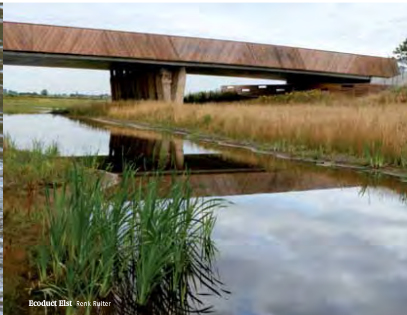
Ecoduct Elst Renk Ruiter

compensatieregeling kan gepaard gaan met de acceptatie van de schade. Pas als dat wordt overschreden is beheer/schadebestrijding door het doden van dieren wat ons betreft aan de orde. Vooralsnog regelen de faunabeheerplannen dat echter andersom: eerst schade bestrijden door aantalsreductie, dan pas financieel compenseren. Dit plaatst ons in een voortdurende discussie met (agrarische) burens over aantalsreductie, of stelt ons voor het feit dat dieren die bij ons opgroeien worden geschoten zodra ze ons terrein verlaten.