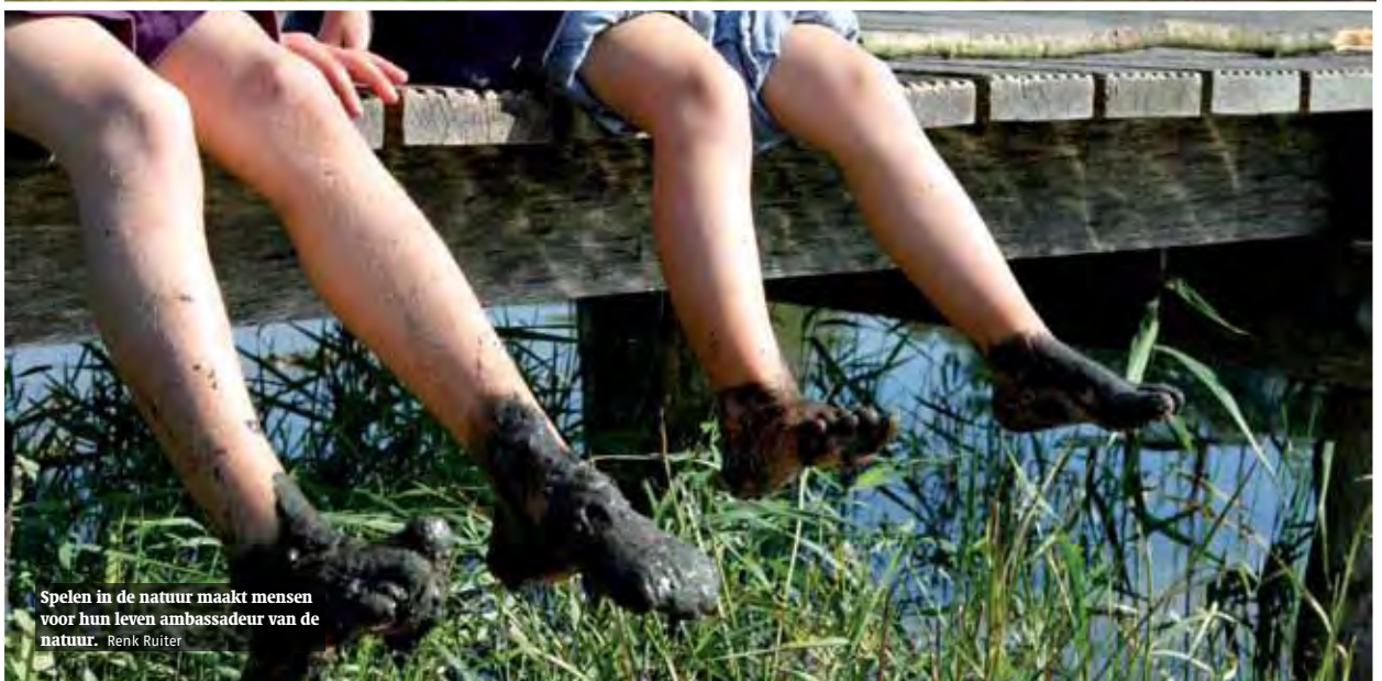
Spelen in de natuur maakt mensen voor hun leven ambassadeur van de natuur. Renk Ruiter