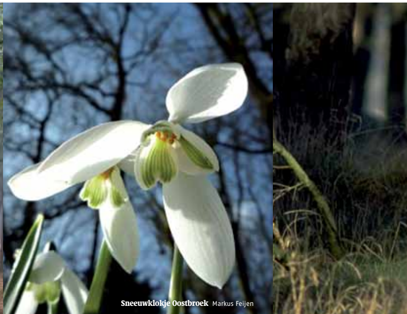
Sneeuwklokje Oostbroek Markus Feijen

kansrijke bodem voor heideherstel. Wanneer een perceel door dunningen niet is om te vormen in een rijk bos, kan soms ook een perceel geheel worden gekapt, om een geheel nieuw, diverser bos te laten ontstaan. Lokaal zal ruimte worden gegeven aan de regeneratie van bos vanuit een situatie gedomineerd door open zand of heide, om ook het habitat van jong, spontaan bos te behouden op de Utrechtse Heuvelrug, zoals het korstmossen-grovedennenbos.