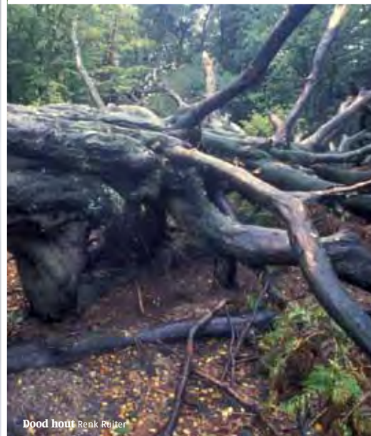
Dood hout Renk Ruiter