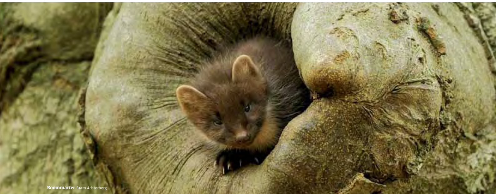
Boommarter Bram Achterberg

De belangrijkste boomsoorten die de afgelopen eeuw op zandgrond zijn geplant hebben zuur strooisel (beuk, eik, alle soorten spar en lariks). Onder bomen met een meer basisch strooisel, zoals linde, iep, es en hazelaar, kan echter een rijkere ondergroei ontstaan. Dit effect is het sterkst op gronden waar een lichte buffering door leem of een flinke eerdlaag in de bodem zit. In zulke situaties zullen plaatselijk boomsoorten met basenrijk strooisel worden aangeplant. Dit zal op kleine schaal gebeuren, om ervaring op te doen en omdat grootschalige verjonging leidt tot grote oppervlakten jong bos, dat pas over enkele decennia rijk aan soorten en aantrekkelijk om te zien zal zijn.