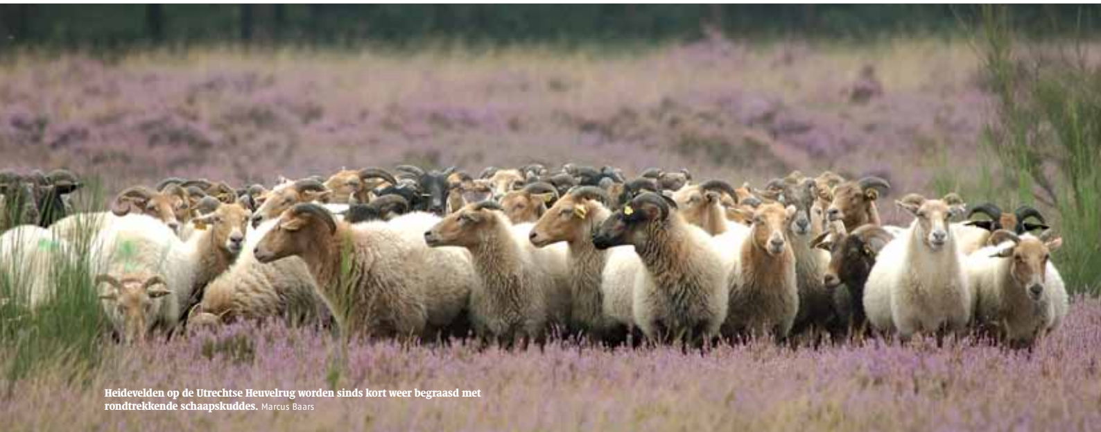
Heidevelden op de Utrechtse Heuvelrug worden sinds kort weer begraasd met rondtrekkende schaapskuddes. Marcus Baars

verschijnen of verdwijnen. Deze indeling biedt mede houvast, omdat we de invloed van zowel natuur als mens in termen van patronen en processen kunnen beschrijven.