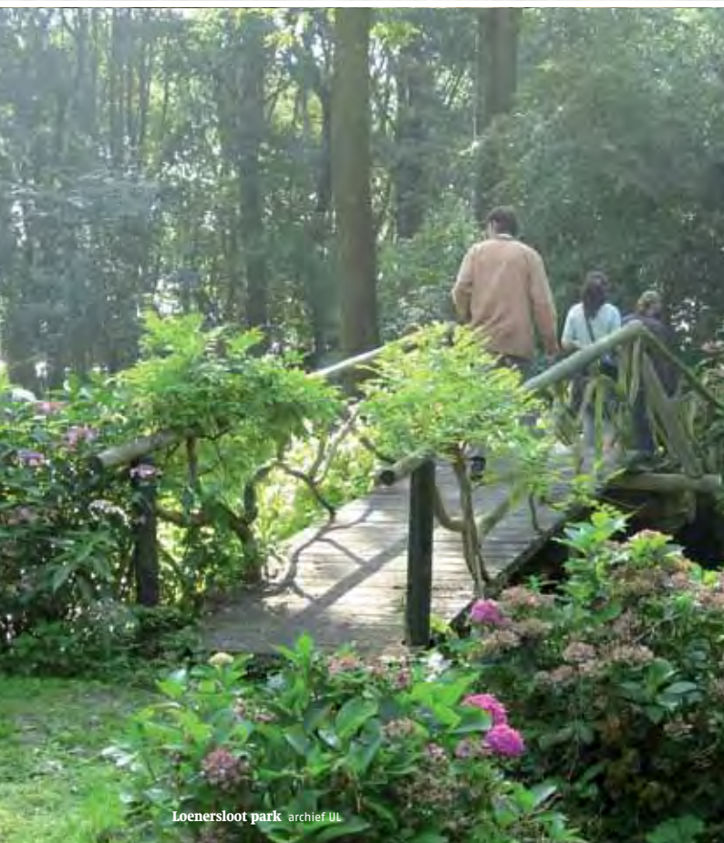
Loenersloot park archief UL