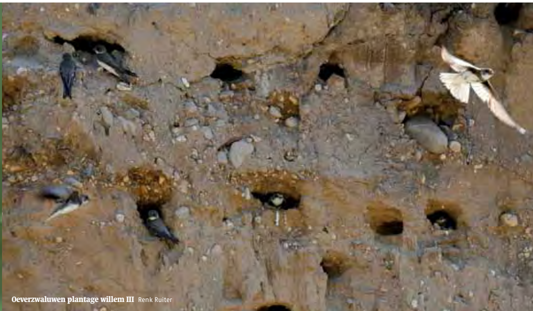
Oeverwaluwen plantage willem III Renk Ruiter