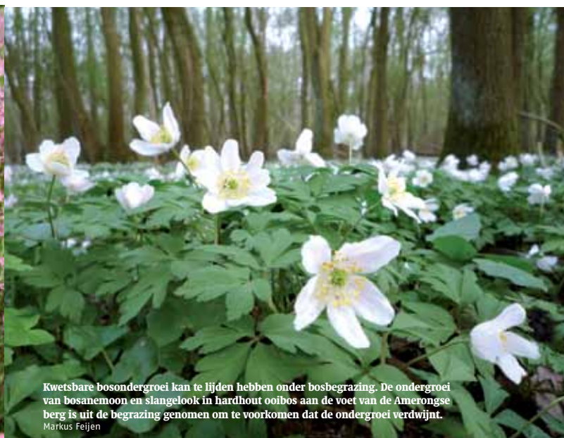
Kwetsbare bosondergroei kan te lijden hebben onder bosbegrazing. De ondergroei van bosanemoon en slangeloek in hardhout oobos aan de voet van de Amerongse berg is uit de begrazing genomen om te voorkomen dat de ondergroei verdwijnt. Markus Feijen