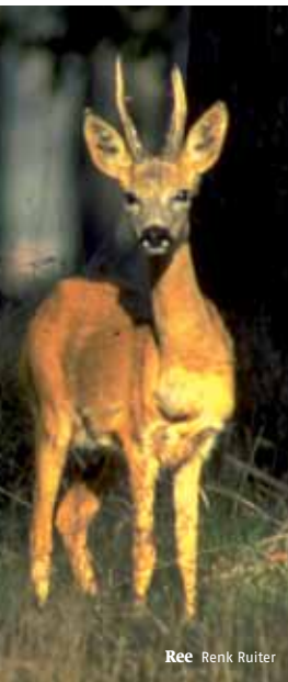
Ree Renk Ruiters