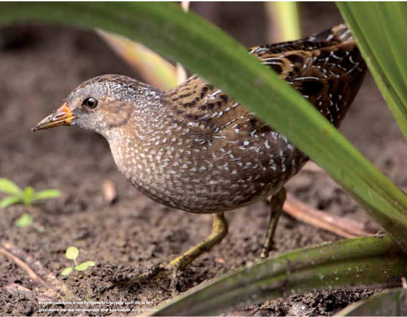
Het porcelijnhoen is een Europees beschermd soort die in de graslanden van den uiterwaarden voor kan komen Harry van Emden