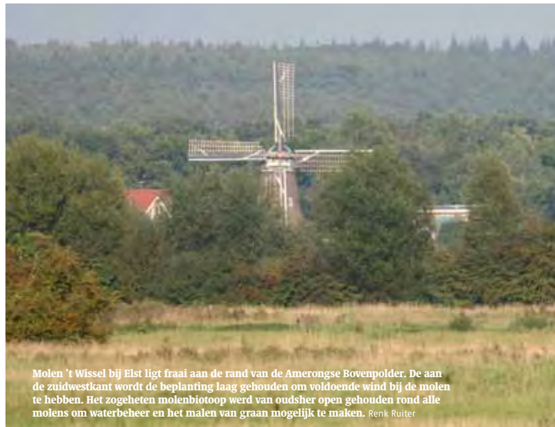
Molen 't Wissel bij Elst ligt fraai aan de rand van de Amerongse Bovenpolder. De aan de zuidwestkant wordt de beplanting laag gehouden om voldoende wind bij de molen te hebben. Het zogeheten molenbiotop werd van oudsher open gehouden rond alle molens om waterbeheer en het malen van graan mogelijk te maken. Renk Ruiter