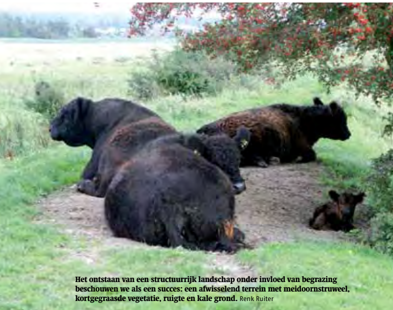
Het ontstaan van een structureel landschap onder invloed van begrazing beschouwen we als een succes: een afwisselend terrein met meidoornstruweel, kortgegraste vegetatie, ruigte en kale grond. Renk Ruiters