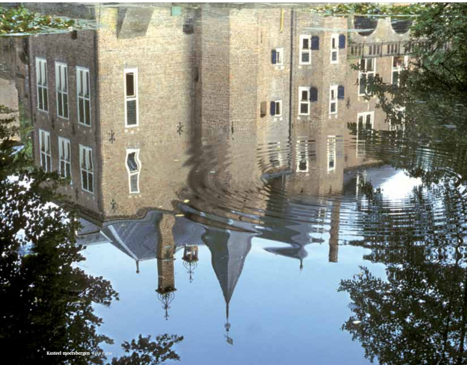
Kasteel moersbergen Renk Ruiter

Buitenplaatsen zijn aangelegd als plek om te ontspannen en de stad te ontvluchten. Het verblijf in het huis en het bijbehorende park waren voor rijke families niet alleen een gelegenheid om zelf te ontspannen (wandelen, tui- nieren, sporten), maar ook om elkaar te ontmoeten. Veel buitenplaatsen werden uiteindelijk permanent bewoond. In de loop van de 20ste eeuw werd het toelaten van publiek op buitenplaatsen steeds gebruikelijker, waarbij vanaf de tweede helft van de 20ste eeuw een groot aantal buitenplaatsen definitief voor publiek toegankelijk werd. Dit laatste heeft voor een belangrijk deel te maken met veranderde eigendomsverhoudingen en fiscale maatregelen. Ten slotte zijn op veel landgoederen en buitenplaatsen experimenten gedaan met diverse soorten van bosbouw zowel vanwege de inkomsten als de interesse van veel eigenaren.