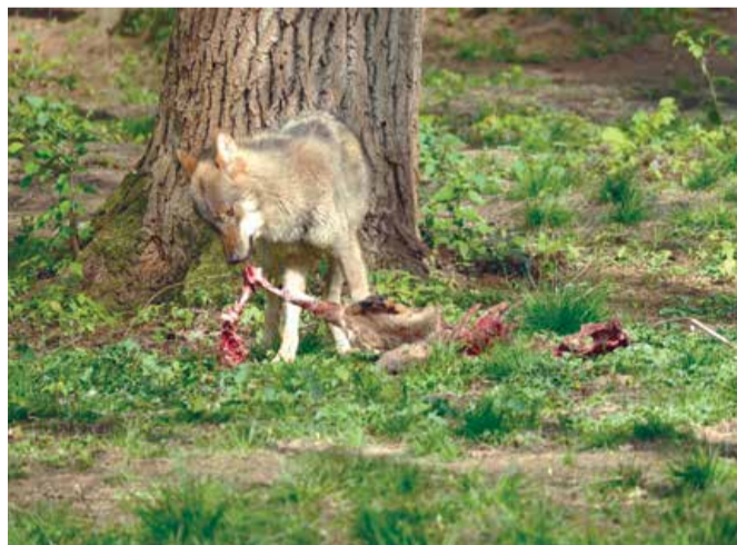
Wolven doden om de paar dagen een wild hoefdier

Wolven die zich gevestigd hebben jagen vooral op grote wilde hoefdieren, zoals ree, damhert, edelhert en wild zwijn. Wolven hebben in de natuur een belangrijke rol als predator. Zo doden wolven om de paar dagen een wild hoefdier. De resten blijven in de natuur achter en vormen een voedselbron voor aaseters, zoals aaskevers, raaf en zeearend.