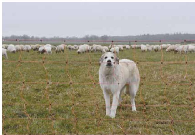
Schrikdraad en kuddewaakhonden vormen samen de beste preventie

Zoals gezegd zijn wolven gespecialiseerd in het eten van hoefdieren zoals ree en wild zwijn. Maar ze maken in principe geen onderscheid tussen wilde dieren en gehouden dieren zoals schapen en geiten. Daarom zijn maatregelen nodig om met name schapen te beschermen tegen aanvallen van wolven. Kuddes paarden en runderen worden minder bedreigd vanwege hun grootte en verdedigende houding.