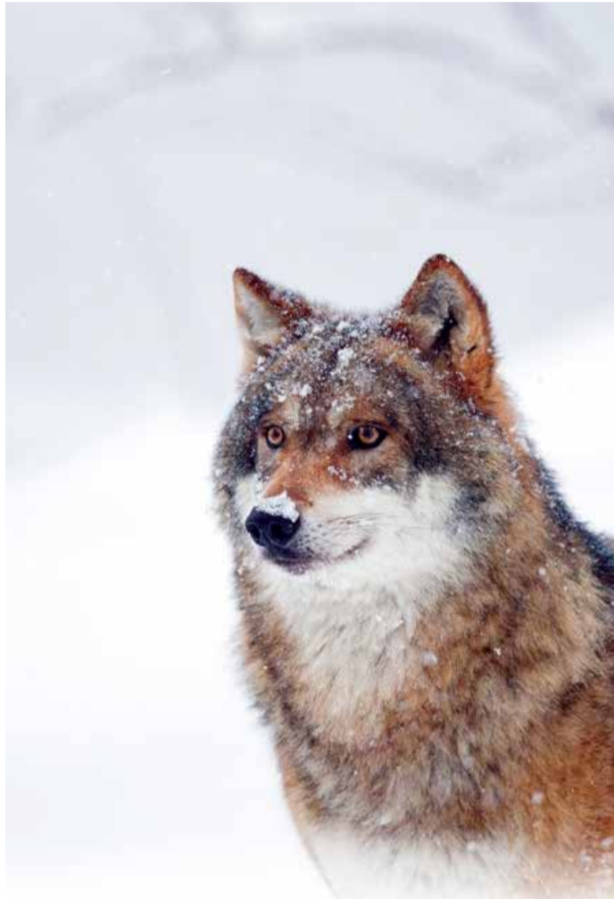
Wolven gedijen in verschillende landschappen

hun dieet. Wolven zijn opportunistisch: als zich een geschikte prooi soort aandient, dan maken ze daar graag gebruik van. Wolven jagen vooral op dieren die makkelijk te vangen zijn, zoals jonge onervaren dieren en oud of zwak wild. Dieren met een snel reactievermogen en een goede gezondheid worden minder vaak gedood. De aanwezigheid van wolven houdt hun prooidieren in beweging met als gevolg dat ze minder op voorspelbare plekken en op voorspelbare tijden aanwezig zijn. Dit werkt door in het gebied waar ze leven. Op plekken waar de grazers minder komen krijgt spontane bosverjonging meer kans. Wat de effecten in Nederland precies zullen zijn, zal de tijd leren.