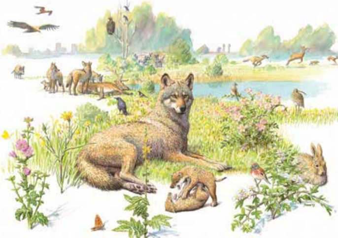
Wolven leven meestal in roedels

In ieder gebied kan slechts een beperkt aantal wovon leven. Elke roedel verdedigt zijn territorium tegen andere wolven. Een territorium in Midden-Europa is meestal 200 tot 300 km 2 groot, maar soms worden territoria van slechts 50 km 2 in zeer voedselrijke gebieden aangetroffen. Een roedel bestaat meestal uit vijf tot tien dieren.