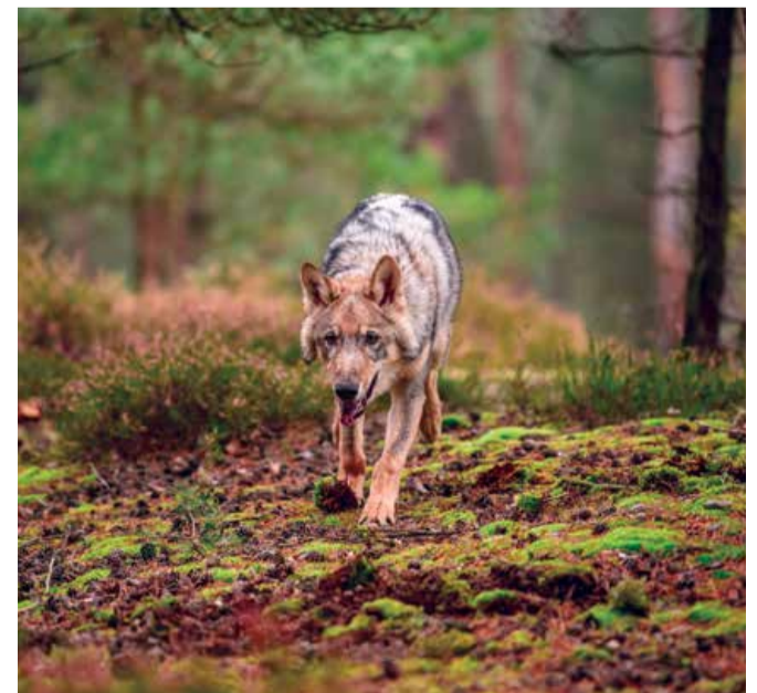
Rondzwerfende jonge wolf op zoek naar eigen leefgebied

Sinds 2015 zijn er weer wolven in Nederland aanwezig. Vanaf 2018 zijn er ook territoriale wolven en in 2019 zijn op de Veluwe de eerste jongen geboren. Naast gevestigde wolven zwerfen er geregeld jonge wolven door Nederland, op zoek naar een eigen leefgebied en partner.