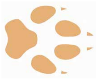
Perfekte tred: de wolf zet zijn achterpoot in de afdruk van de voorpoot