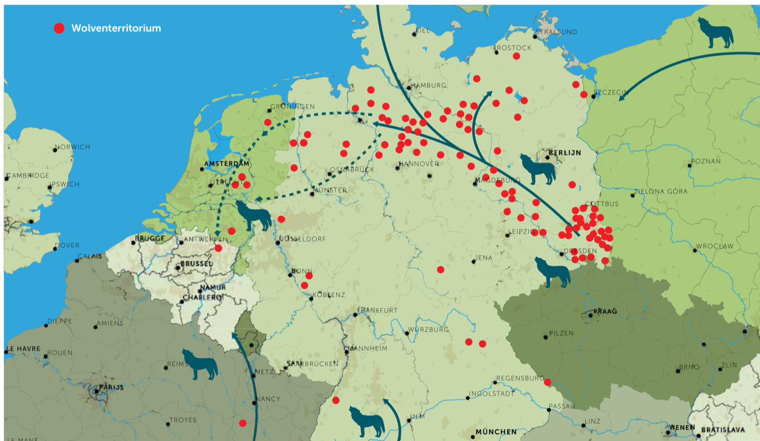
De verspreiding van wolvenroedels en wolventerritoria in Nederland en onze buurlanden